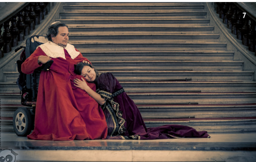
5 Drakiáda 29. 10. 2014