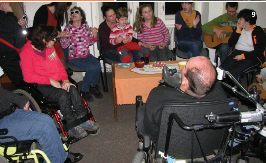
8, 9 Mikulášská besídka 3. 12. 2014